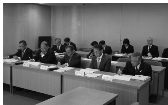
一般会計主要事業はじめ当初予算内示