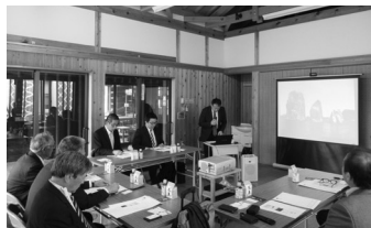
地産地商課長より概要及び取り組みについて説明

地方創生の先進事例として全国から年間200団体2,500人が視察に訪れる島根県離島の挑戦