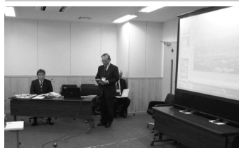
行政評価を導入し改革を推進する飯田市議会