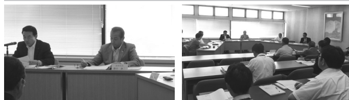
付託3議案・1請願についての審査