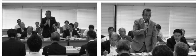
2日間にわたる一般会計・特別会計の決算審査