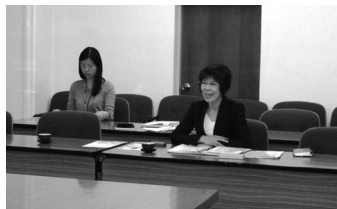
対処から予防へとパラダイムシフトした尼崎市

茨城空港の利用促進も兼ね兵庫県を視察。尼崎市「ヘルスアップ尼崎戦略事業」、宍粟市「コミュニティ・スクール」、丹波市「定住促進対策・空き家対策」について調査してきました。