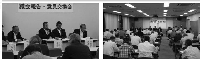
述べ145名の市民の方々が参加