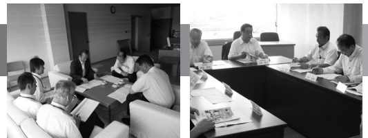
広報委員会で導入について協議・提案

より多くの皆さんに市議会の活動をわかり易くお伝えし、関心を高めていただくために、常陸太田市議会公式Facebookページを開設します。市議会の活動やお知らせを中心に掲載されますので是非ご覧下さい。