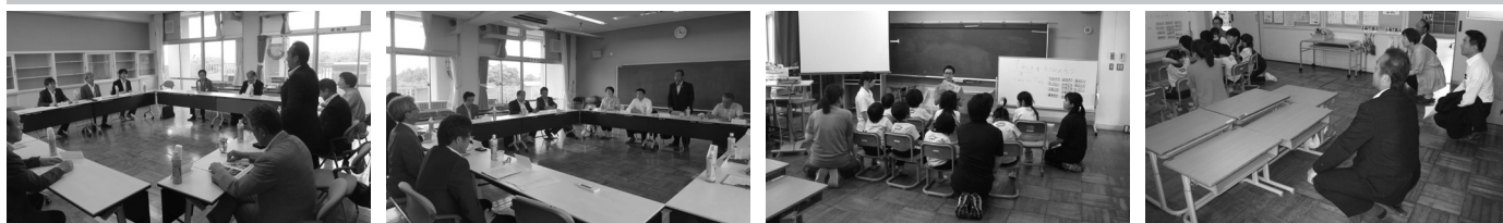
今春より小学部48名、来春からは中学部・高等部が加わり、約150名が通学予定