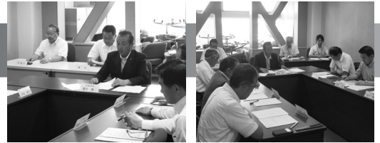
議会運営委員会において見直しを議論

議会改革の一環として、予算特別委員会及び決算特別委員会の審査充実を図るための検討を進めてきた結果、今年9月に開催される決算特別委員会から、議長及び議会選出監査委員を除く全議員により、審査を行うこととなりました。