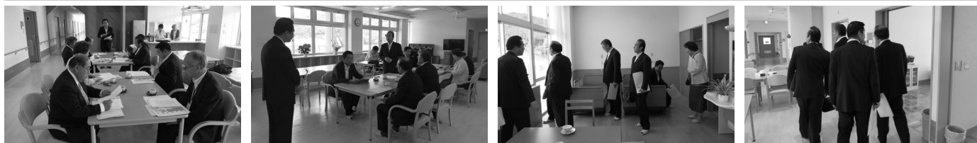
1階がケアセンター、2～3階がサービス付き高齢者住宅