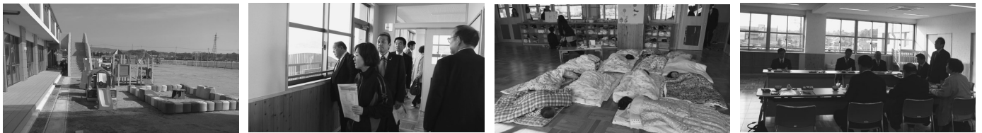
2月に開園した私立保育園の現地視察