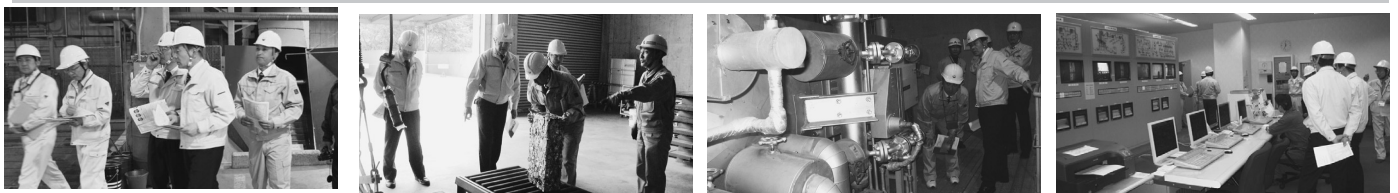
資源ゴミの収集状況など現地視察