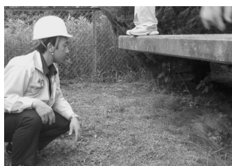
金砂郷小学校地盤沈下