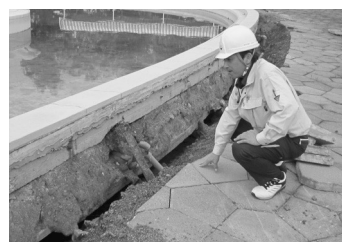
山吹運動公園プール

「住みたい」「住んでよかった」「住み続けたい」 と思えるまちにみんなで創っていきましょう。