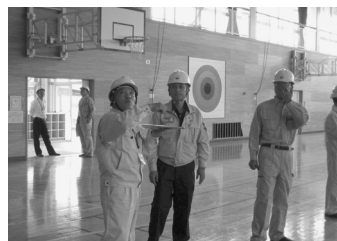
佐都小学校体育館