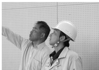
太田小学校体育館

化施設の被災状況について現地調査を行い、改めて今回の地震による被害の大きさを再認識すると同時に、特に子供たちの教育環境の復旧を早急に進める必要性を感じました。