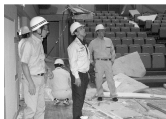
交流センターふじ大ホール