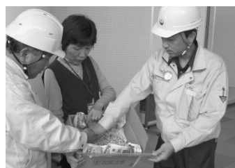
交流センターふじ