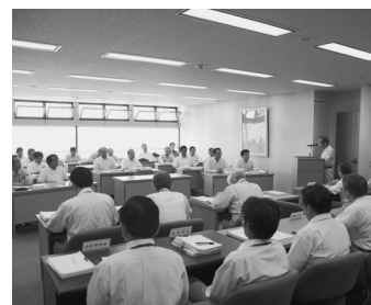
臨時議場での6月議会