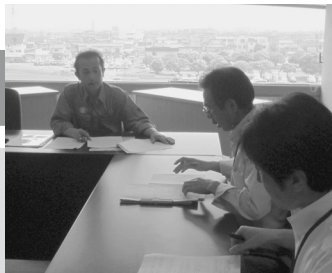
質問に向けた調査