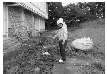
金砂郷小学校体育館